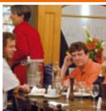
Le Pré Salé

Trek de portemonnee en koop die geweldige designerjurk.