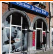
Éditions Jacques Brel

De beroemdste Belgische chansonnier zien optreden.