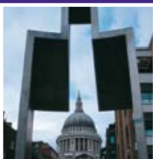
St. Paul's Cathedral

Genieten van een lekker ontbijt of uitgebreide brunch.