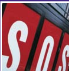
Smiths of Smithfield

Genieten van een lekker ontbijt of uitgebreide brunch.