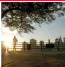
Brooklyn Heights Promenade

Een kijkje nemen in de bekendste kerk van Brooklyn.