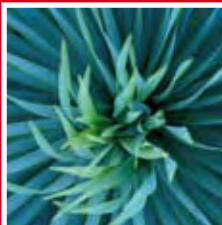
Brooklyn Botanical Garden