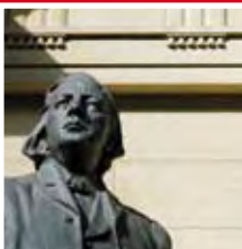
Plymouth Church of the Pilgrims

Een kijkje nemen in de bekendste kerk van Brooklyn.