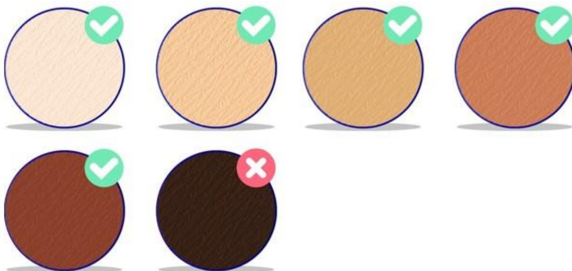
Tableau de couleur de cheveux